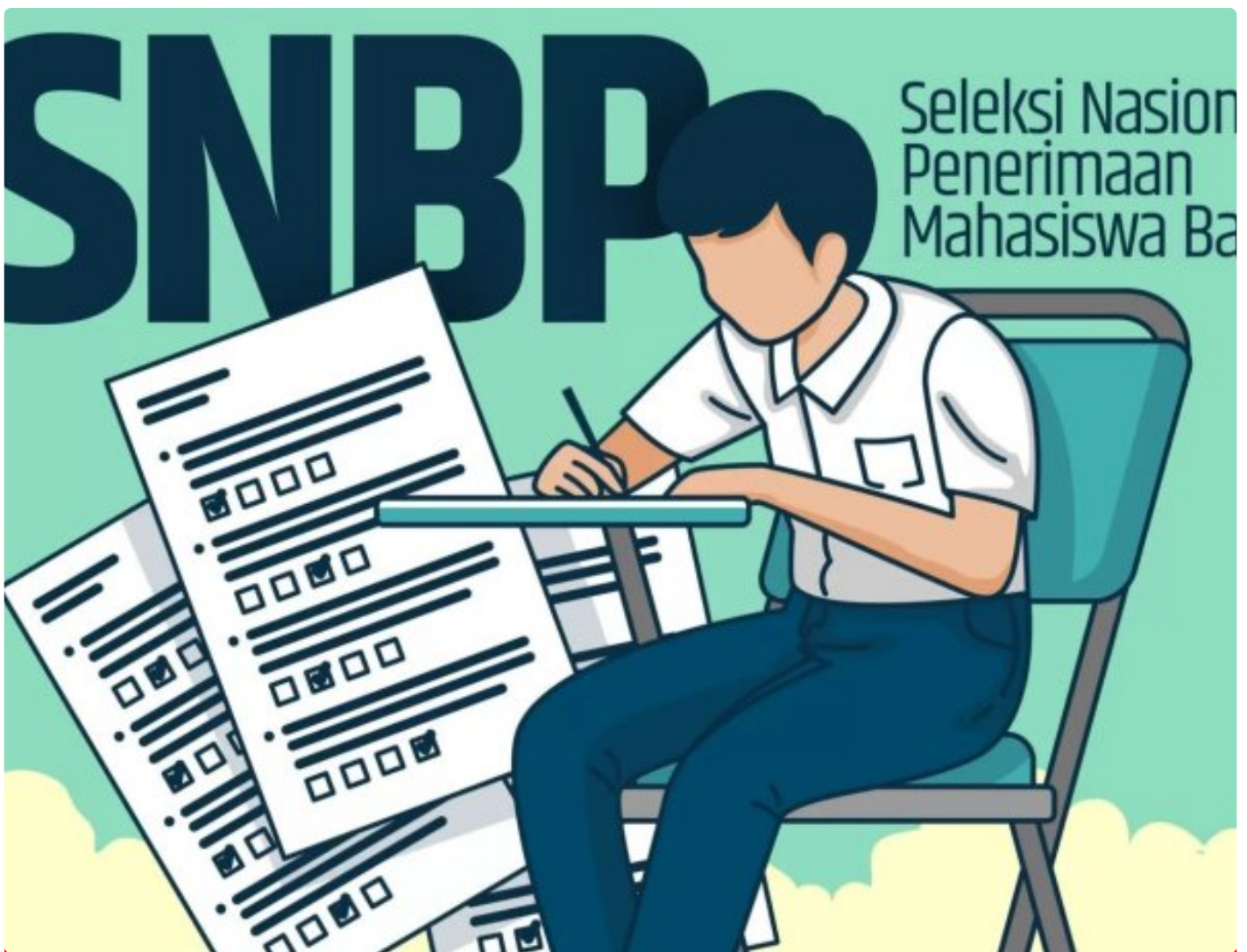
Ilustrasi seleksi SNBP

BANYUWANGI - Prestasi menggembirakan diraih siswa-siswi SMA maupun SMK di Banyuwangi. Tahun ini, jumlah siswa asal Banyuwangi yang lolos masuk Perguruan Tinggi Negeri (PTN) lewat jalur Seleksi Nasional Berdasar Prestasi (SNBP) tahun 2024 mengalami peningkatan cukup drastis dibandingkan tahun