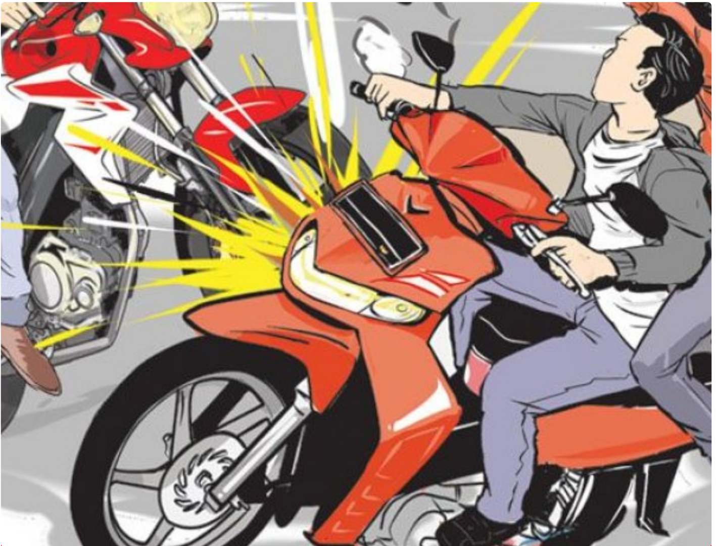
Ilustrasi laka lintas

BANYUWANGI - Dua unit sepeda motor mengalami kecelakaan lalu lintas adu banteng di Jalan Raya Jember, Desa Tulungrejo, Kecamatan Glenmore,